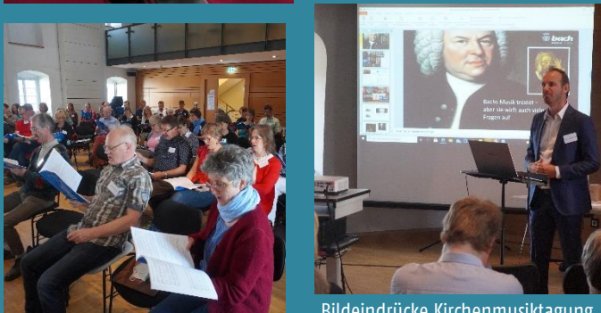
Bildeindrücke Kirchenmusiktagung von September 2021

„Seelsorgliche Aspekte in der Kirchenmusik“