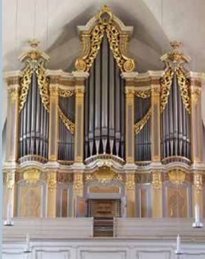
PETRIKIRCHE FREIBERG Gottfried Silbermann 1735