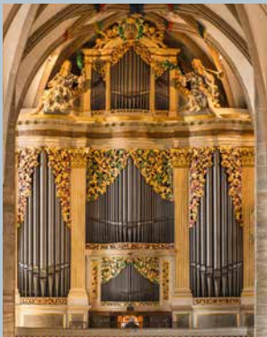
DOM ST. MARIEN FREIBERG Gottfried Silbermann 1714

Das Jugendorgelcamp bietet Dir die perfekte Gelegenheit, einmal die großartigen und weltberühmten Silbermann-Orgeln zu spielen!