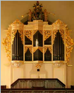
JAKOBIKIRCHE FREIBERG Gottfried Silbermann 1717